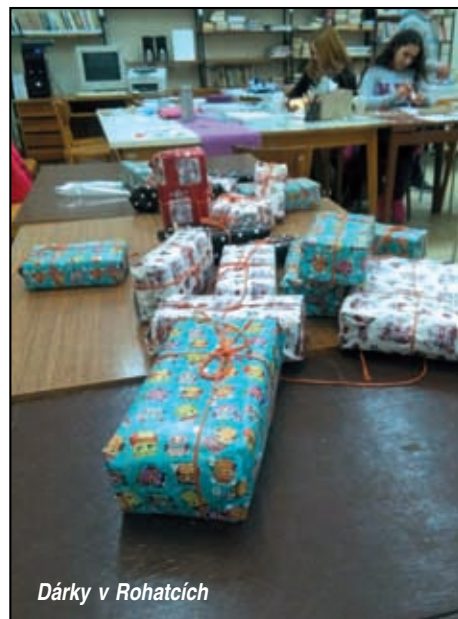
Dárky v Rohatcích

už to vědí, zeptejte se jich. Po pohádce děti kreslily Ježíška. Zjistili jsme, že si každé dítě Ježíška opravdu představuje jinak. Došlo i na balení dárků, kterými jsme později zdobili stromek u kaple. Co je ale nejdůležitější, děti si napsaly dopis Ježíškovi. Přání bylo opravdu hodně. A nejen děti, ale i my, dospělí, se moc těšíme na Ježíškovu odpověď. No a jestli Ježíšek přání splnil? To my nevíme, ale jistě byly všechny děti spokojené.